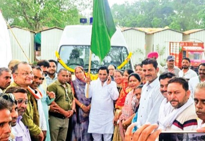
हरिभूमि न्यूज ▶▶▶ खंडवा

सामाजिक दायित्व योजना के तहत विकासखंड पुनासा के सामुदायिक स्वास्थ्य केंद्र मूंदी को नई एंबुलेंस प्रदान की गई है। यह एंबुलेंस मांथादा विधायक नारायण पटेल के प्रयासों से उपलब्ध कराई गई। गुरुवार को मूंदी अस्पताल परिसर में एंबुलेंस का लोकार्पण किया गया। इस अवसर पर नारायण पटेल ने खंड चिकित्सा अधिकारी रविन्द्र मंडलोई को वाहन की चाबी सौंपी। नई एंबुलेंस मिलने से क्षेत्रवासियों को आपातकालीन स्थिति में बड़ी राहत मिलेगी। मरीजों को आकस्मिक स्वास्थ्य सुविधाएं शीघ्र उपलब्ध हो सकेंगी और अस्पताल प्रबंधन को भी गंभीर परिस्थितियों में मरीजों को समय पर स्वास्थ्य सेवाएं देने में सुविधा होगी। एंबुलेंस से गांव और आसपास के क्षेत्रों से मरीजों को तुरंत अस्पताल पहुंचाया जा सकेगा। इससे दुर्घटना या अन्य आकस्मिक स्थिति में मरीजों के जीवन को बचाने में मदद मिलेगी। लोकार्पण कार्यक्रम के दौरान अस्पताल स्टाफ और स्थानीय नागरिकों ने आभार जताया। एंबुलेंस सुविधा से क्षेत्र के स्वास्थ्य ढांचे को मजबूती मिलने की उम्मीद जताई जा रही है।