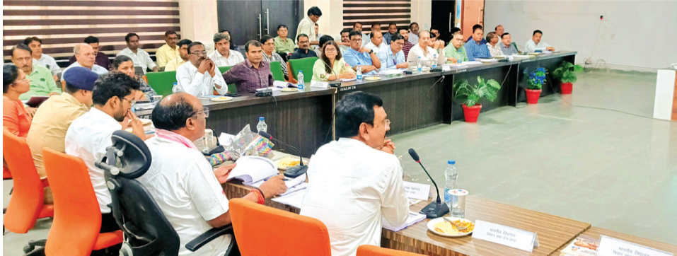
दिशा की बैठक में केन्द्रीय मंत्री श्री उड़के ने दिरे निर्देश