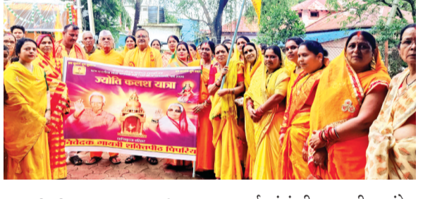
पचमढी

अखिल विश्व गायत्री परिवार की वंदनीय गुरु माताजी के जन्म के सौ वर्ष पूर्ण होने की पूर्वबेला में आज शांतिकुंज हरिद्वार से ज्योति कलश हमारे नगर पचमढी में पहुंचा एवं ज्योति कलश यात्रा नगर के प्रमुख मार्गों से निकली गई जगह जगह ज्योति कलश यात्रा का स्वागत किया गया। उसके पश्चात मां गायत्री प्रज्ञा पीठ पचमढी में सामूहिक दीप यज्ञ किया। ज्योति कलश यात्रा के माध्यम से नगर में परम पूज्य गुरुदेव श्री राम शर्मा आचार्य एवं वंदनीय माता जी का संदेश दिया गया। एवं आगामी वर्ष में होने वाले समारोह की जानकारी भी दी गई। बताया गया कि हम सुधुरंगे युग सुधुरंगा हम बदलेंगे युग बदलेगा एवं गुरु जी के साहित्य के द्वारा विचार क्रांति अभियान चलाया जा रहा है। ज्योति कलश का रथ शांतिकुंज हरिद्वार से परम पूज्य गुरुदेव श्री राम शर्मा आचार्य का आशीर्वाद प्राप्त होशंगाबाद एवं पिपरिया गायत्री शक्तिपीठ के परिजनों द्वारा पचमढी लाया गया। ज्योति कलश यात्रा में पचमढी नगर के सभी गायत्री परिजनों ने अपनी सहभागिता दी।